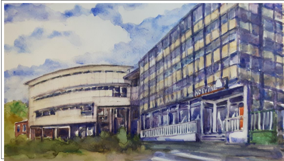
Aquarelle A Ghimouz